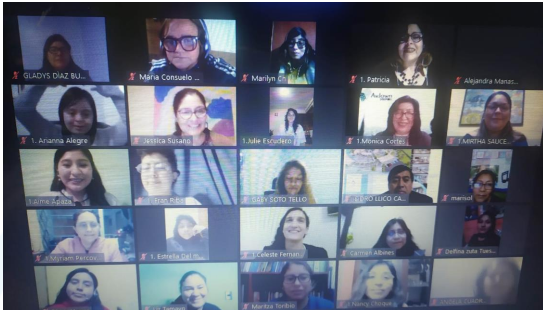
Foto 2. Participantes del evento Valorar la diversidad: Hacia una educación de Calidad

Como cierre, se brindó el agradecimiento y exhortó a los participantes a seguir sumándose en ser voceros de estos temas y que sigamos de pie en la lucha por una educación inclusiva que acepta a todos por igual en derechos.